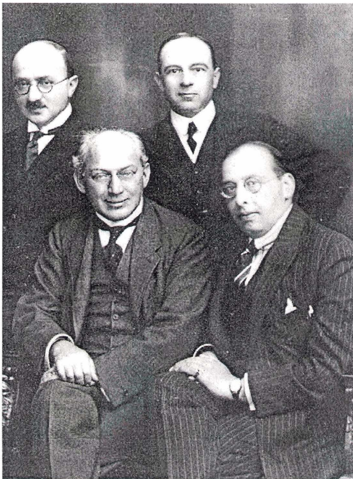
ngon, Sandor Ferenczi, Ernst Jones en Hans Sachs.

Freud hechte eraan dat zijn gedachtegoed als wetenschap werd